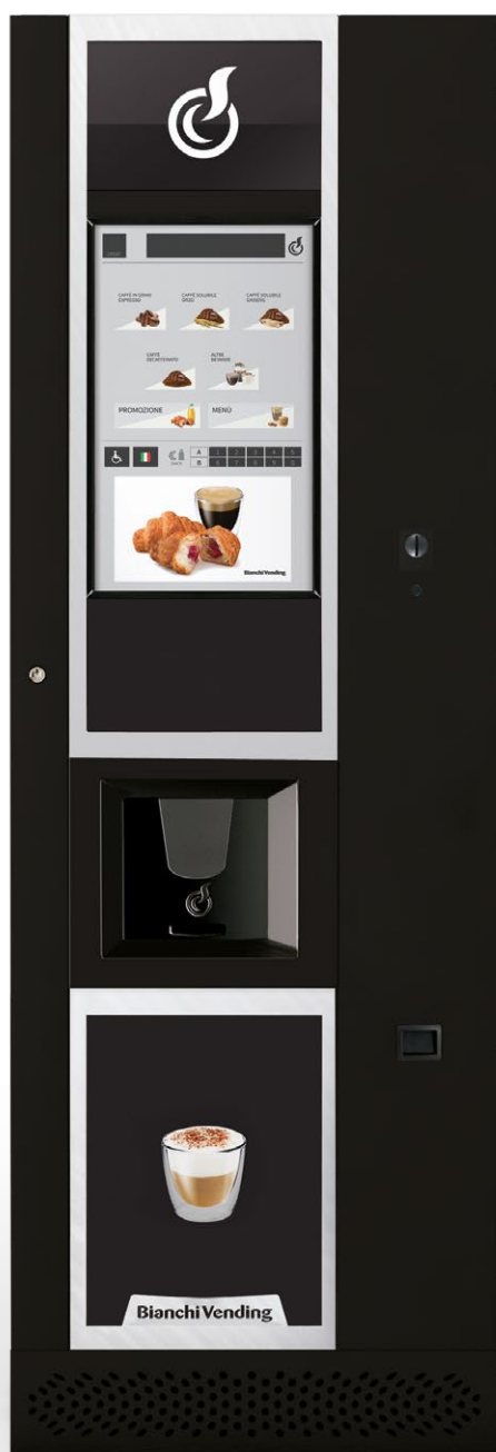
LEI600 TOUCH 21*