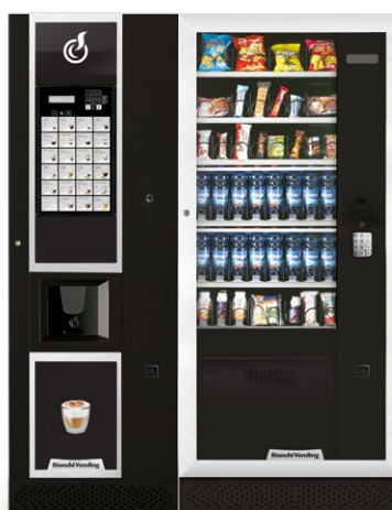
LEI600 SMART + ARIA L MASTER

LEI600, distribuidor automático para bebidas quentes com capacidade de 600 copos com painel de 24 seleções diretas (Versões Easy e Smart). Painel de seleção facilmente intercambiável para melhor adaptação a diferentes locais.