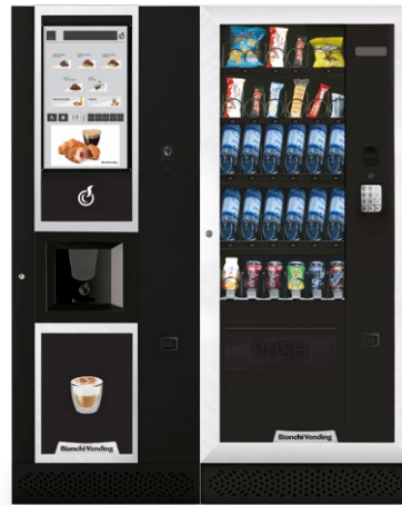
LEI400 TOUCH 21" + ARIA M MASTER